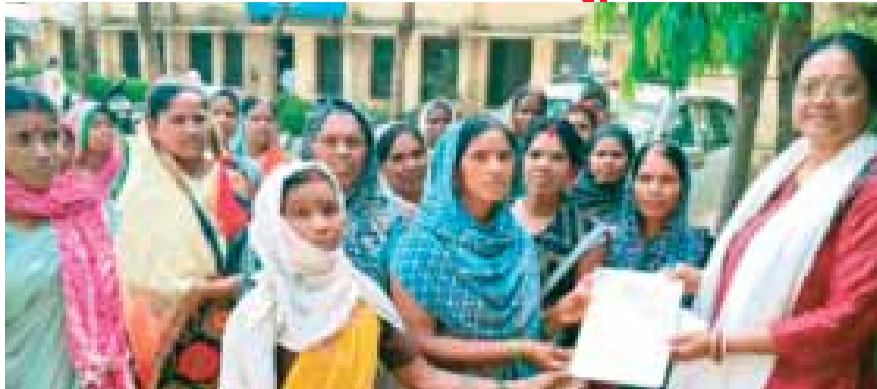
हरिभूमि न्यूज | पांडुर्णा

विकासखंड के ग्राम भैसाडोंगरी में महिलाओं को आर्थिक रूप से सशक्त बनाने के उद्देश्य से गठित 'साई संगठन स्वसहायता समूह' में धोखाधड़ी का बड़ा मामला सामने आया है। समूह की सचिव पर 8 लाख रुपये से अधिक की राशि के गबन का गंभीर आरोप लगा है। इस